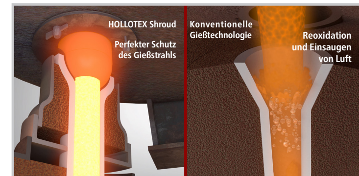
Vergleich von HOLLOTEX Shroud und konventioneller Gießtechnologie