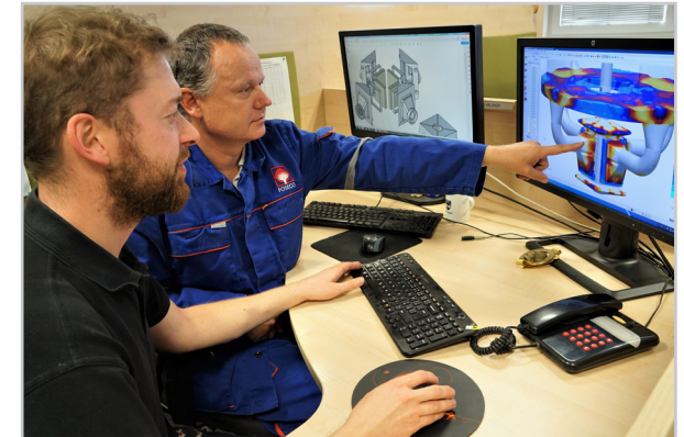
Unterstützung durch Simulation