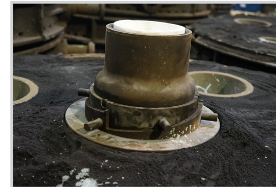
HOLLOTEX Shroud Hebemechanismus