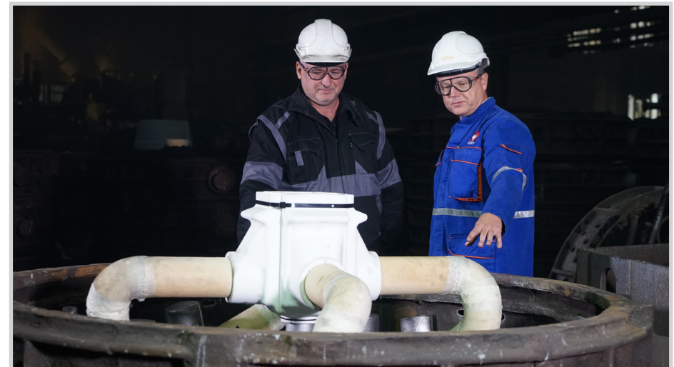
HOLLOTEX Shroud Filter Box während der Formherstellung

HOLLOTEX Shroud stellt ein neues Verfahren dar, das effektiv in Stahlgießereien eingesetzt werden kann. Es besteht aus einem in die Gießform integrierten Schutzrohr. Das untere Ende des Schutzrohrs reicht in die Filter Box, die sich unterhalb des Formhohlraum befindet. Ist die Stopfenpfanne in Gießposition, wird das Schutzrohr mechanisch angehoben und an den Ausguss angebunden. Eine Dichtung sorgt für einen luftdichten Übergang vom Ausguss zum Schutzrohr. Die Schmelze fließt nun geschützt in die Filter Box, wird dort filtriert und anschließend über das Gießsystem dem Gussteil zugeführt. Während des Gießvorgangs ist die Schmelze vor Oxidation geschützt. Auch ein Mitreißen von Luft im Bereich des Eingusses wird vermieden.